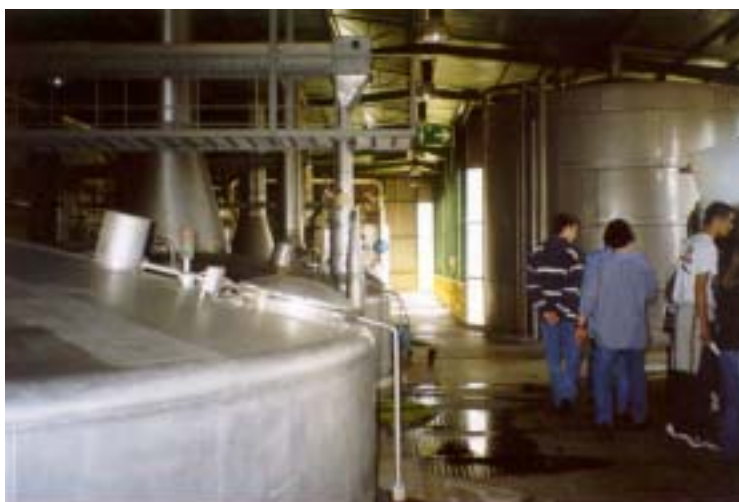
Fig. 1 – Caldeira de cozedura moderna (mais eficiente que as da sala ao lado).

Quanto à cerveja, é fabricada a partir de água, malte (cevada) moído, leveduras e lúpulo (que dá o aroma característico à cerveja). O malte, quando torrado, dá a cor preta à cerveja preta. O malte é misturado com água quente, sendo de seguida prensado, altura em que se retira o mosto. As farinhas que ficam na prensa – drés – não tendo mais nenhuma utilidade no fabrico da cerveja, é dado ao gado. Ficando só com o mosto, este é cozido e lupulizado. O lúpulo, além de dar o sabor ligeiramente amargo, aumenta também o tempo de conservação da cerveja. Depois da filtração, o mosto é fermentado com leveduras. A reacção é complexa, mas traduz-se pela equação C_6H_{12}O_6 \rightarrow 2C_2H_5OH + 2CO_2 . Para produzir a cerveja sem álcool basta fazer uma fermentação muito mais pequena do que a que se faz para uma cerveja normal. Para medir o álcool da cerveja usa-se um aparelho chamado sacarómetro. Depois a cerveja vai para os depósitos de maturação, onde repousa, para depois ser filtrada para os processos de embalagem, onde é inserida em garrafas, latas ou barris.