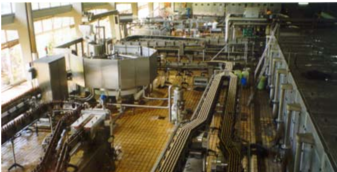
Fig. 4 – Visão geral de uma linha de montagem, onde se engarrafa a cerveja.

onde a cerveja repousa. Aqui a cerveja fermentada deve repousar duas ou três semanas em grandes tanques fechados, a fim de “envelhecer”. Os depósitos eram enormes e o compartimento frio, condição essencial para a conservação da cerveja.