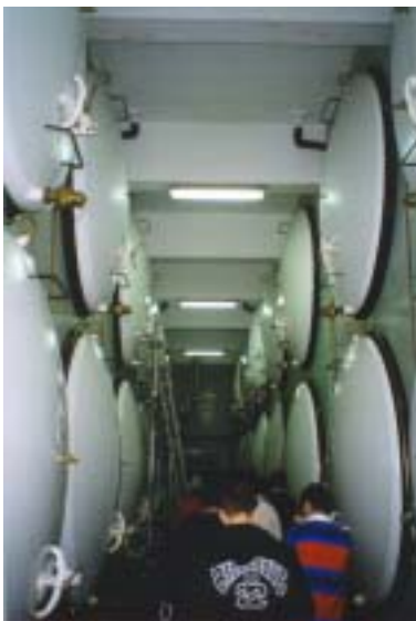
Fig. 3 – Corredor com ladeado por depósitos de maturação.

Seguiram-se os depósitos de maturação (fig. 3)